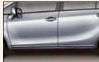
Chromowane listwy boczne