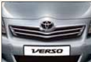
Chromowana listwa na grill