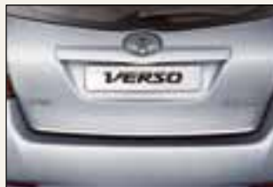
Chromowana listwa na klapę bagażnika