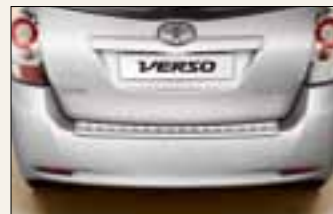
Nakładka ochronna na tylny zderzak

DOPEŁATA DO WERSJI 7-MIEJSCOWEJ TYLKO 1 000 PLN