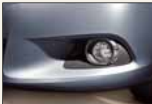
Chromowana obudowa lamp przeciwmgielnych (nie dotyczy wersji Luna)