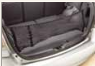
Pionowa siatka na ładunek